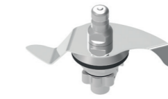
PÉTRIN XL* pains, brioches, pâtes en grande quantité