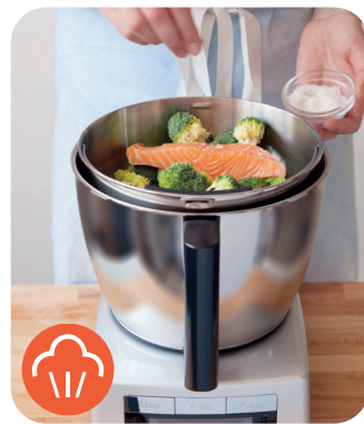
CUIRE À LA VAPEUR