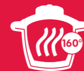
BOL THERMO maintien au chaud 2h