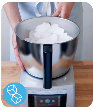
PILER LA GLACE