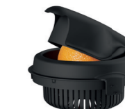
PRESSE-AGRUMES 2 cônes pour petits et gros agrumes