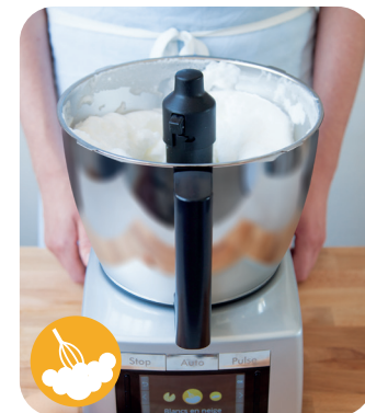
BATTRE LES BLANCS