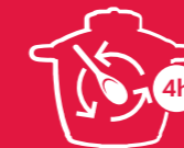
MIJOTAGE COCOTTE pour une cuisson douce