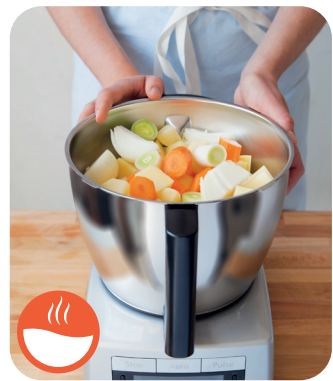
CUIRE ET MIXER