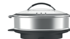
PANIER VAPEUR XXL +5,5 L en complément du panier vapeur inclus