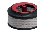
EXTRA PRESS XL extraire à froid des jus et smoothies de fruits et légumes