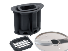
CUBES ET BÂTONNETS cubes de fruits ou légumes mais aussi des bâtonnets ou des frites