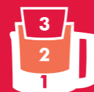
BOL 3 en 1 râper, émincer et hacher