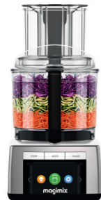
3 BOLS MULTIFUNCTION