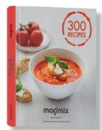
LIVRE DE RECETTES